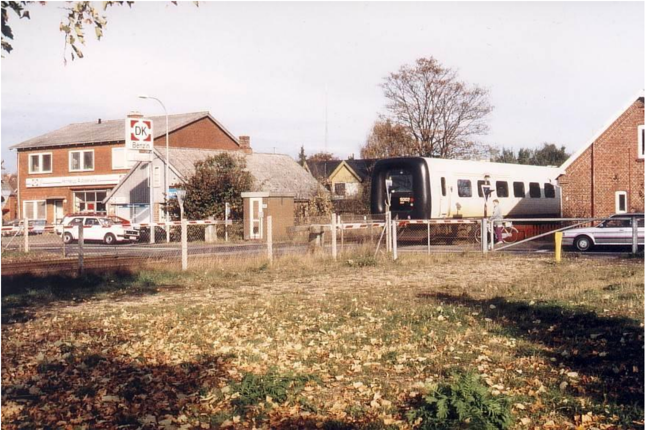
Jernbaneoverskæringen i Vestergade.