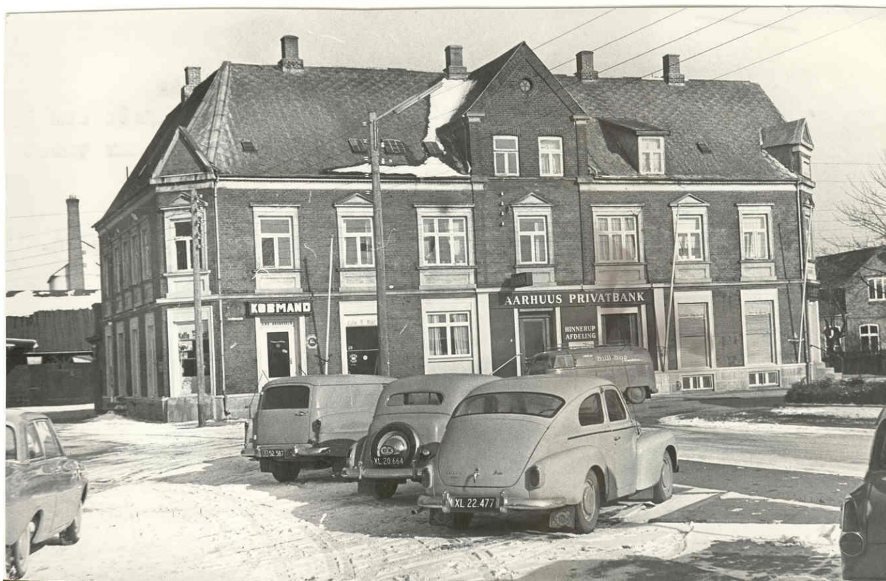
Hinnerup Hus på Banegårdsplads

Det var en stor ting at vi selv skulle arrangere det hele og at vi selv skulle sørge for at invitere en pige med, som vi hver især syntes om. Ved indmarchen havde vi pigen i hånden ind i salen og så var der ellers dans og fest.