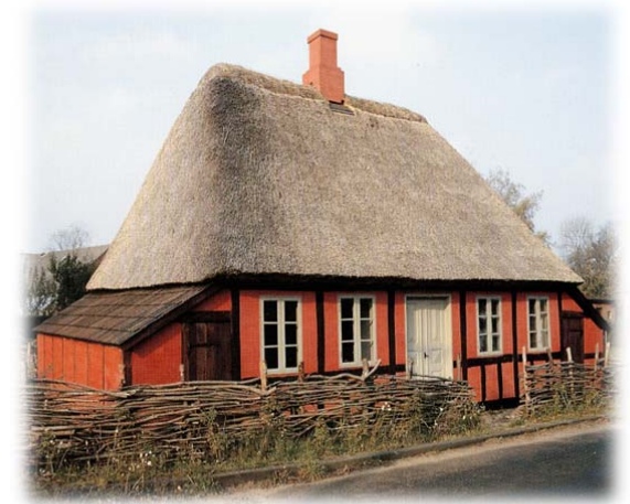
Nørrerisvej 4, Norring