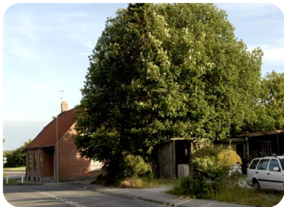
Grandepladsen i Grundfør som den ser ud i dag.

I Grundfør, hvor folk blev tilkaldt til gadestævne ved trommeslagning, stod gadetræet ved den midterste gård i byen.