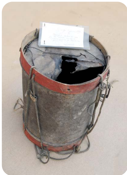
Bytrommen i dag.