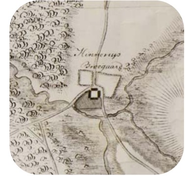
Brogården før 1848

Den nye Brogården der blev bygget på samme sted var meget beskeden i forhold til den gamle. Gården var nu reduceret til et husmandssted. Fæster på