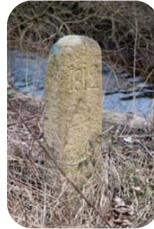
Toldsten ved Hinnerup Bro

I 1812 blev der rejst en brun granitsten ved denne bro (Hinnerup Bro) en slags toldsteds skilt som man ser det ved toldsteder i dag. Den var tegn på at der skulle betales til Hinnerup Brogård for at passere Lilleåen.