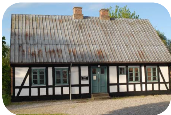
Hinnerup Egnarkiv 2010.

Hinnerup Egnarkiv blev stiftet med vedtagelsen af vedtægter i Hinnerup Byråd den 29. juni 1981.