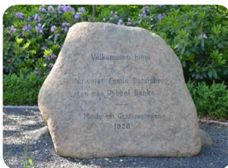
Teksten på stenen lyder: Velkommen hjem. Nu vajer gamle Dannebrog igen paa Dybbøl Banke. Minde om Genforeningen 1920

Samme sted står der en af de fire genforeningssten, som findes i den tidligere Hinnerup Kommune.