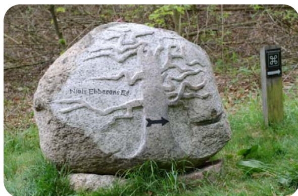
Udført af stenhugger Hans Hansen i Tingvad.

Blot et par uger før pinsedag, hvor flere hundrede mennesker kom forbi, stod Niels Ebbesens eg, som menes at være 500-600 år gammel, med sit nyudsprungne løv så flot som nogensinde. Egen så sund ud, men ved roden viste det sig, at stammen var gennemtrængt af svamp.