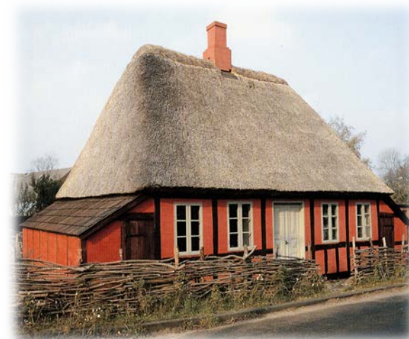
Nørrerisvej 4, Norring