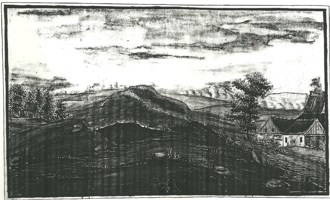
Høi med Jyndovn ved Zeuthen By, Vest-Lisbjerg Herred, Århus Amt.

Paa Provinciaalkortet over Århus Amt, er denne Gaard benævnet: Riis Hovgaard , hvilket Navn den i de sidste Aar har havt. – Vel findes ikke een eneste Inscription paa Steen, Mure eller andet; thi Bygningerne selv have gandske tabt deres hæderlige Udseende, og ere nu omdannede til højst simple Bondeboeliger; da 2 Gaardmænd boe nu der – men, som Bygningerne selv intet have beholdt af deres ældgamle Anseelse, saa synes dog Belliggenheden endnu at minde os om den store Mand, der eengang havde her sit Sæde. – Om, og ved Gaarden, især ved dens nordlige Side findes endnu Volde circa 4 All: høje, der i de sidste 8 Aar ere betydeligen formindskede. Man pløjer dem, og derved sløjfes de inneret meere. – Løbegrave sees endnu udtørrede, tæt østen om Gaarden, og disse meget dybe. Gaarden ligger ved Foden af saare høje Bakker; inden i Riis Skov, der tilhører Grevskabet Frijsenborg . Kongevejen mellem Schanderborg og Randers gaar \frac{1}{8} Mil nær denne Skov. – Endnu sees noget af en Broelægning som fra en Herregård, ud fra Gaarden ind i Skoven. – Den betydelige Foran-