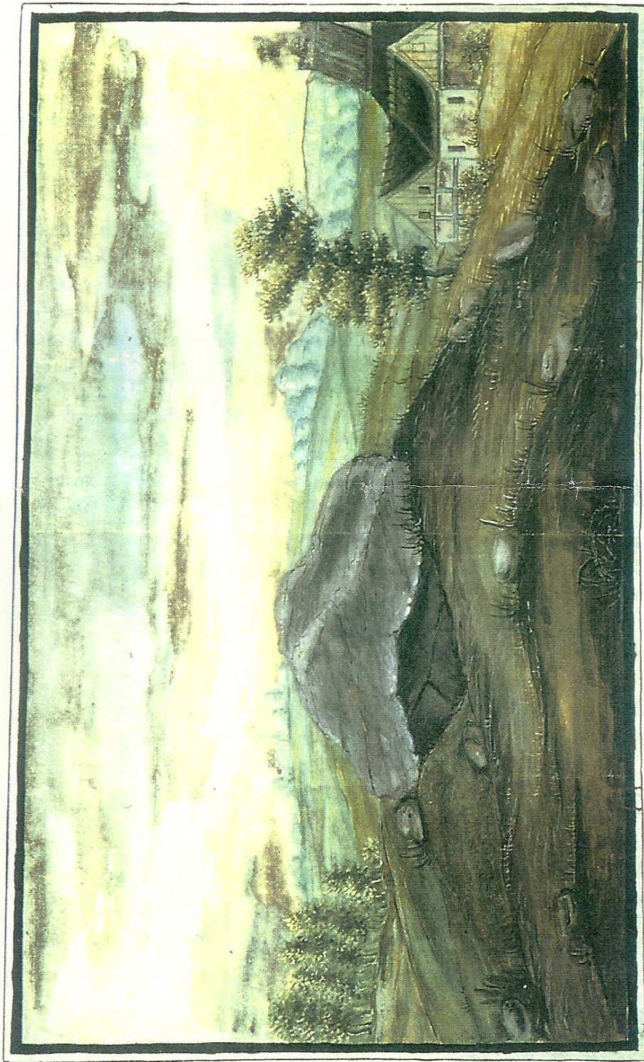
Hoi med Jyndovn ved Zeuthen By, Vester-Lisbjerg Herred, Aarhuus Amt.